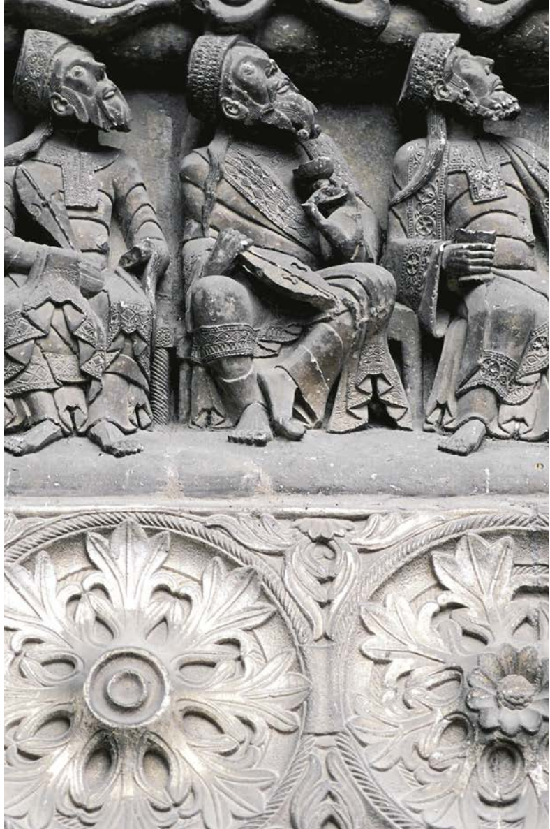
Détail du tympan de l'abbatiale Saint-Pierre