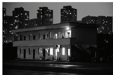
La Ville de Pékin

Horaires Tous les jours 10h >12h - 14h >18h Fermé le mardi