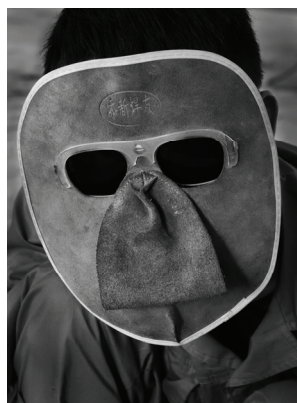
Le Festival des lanternes