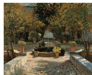
Santiago Rusiñol y Prats (1861-1931) La Cour des orangers, 1904, huile sur toile

1 visite-atelier (cycle 2 et 3) autour du thème de la couleur